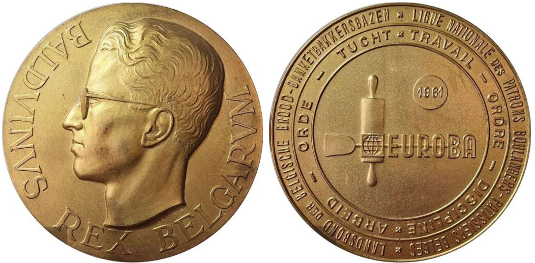
Prijspenning type 5 (1961)

I N NAVOLGING VAN HET ARTIKEL De prijspenningen van de Landsbond der Belgische Bakkersbazen in ons Jaarboek van 2019 (p. 89-97) mag het lijstje met prijspenningen aangevuld worden met een opmerkelijke vaststelling: in 1961 heeft deze bond zowel penningen van het type 2 als het type 5 toegekend.